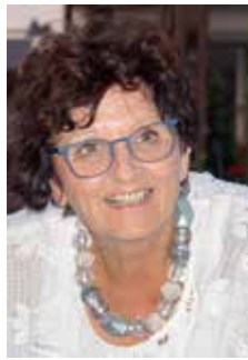
Leitung: Dr. Christel Frey

Die drei Teile bauen aufeinander auf. Sie haben jedoch die Möglichkeit, nach dem ersten bzw. zweiten Teil auszusteigen. Ein Quereinstieg ist nicht möglich.